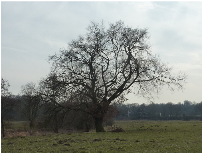
Altbaum in der Lippeaue 2018