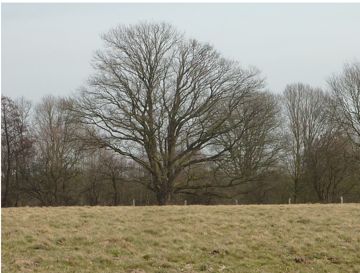
Altbaum in der Lippeaue 2018