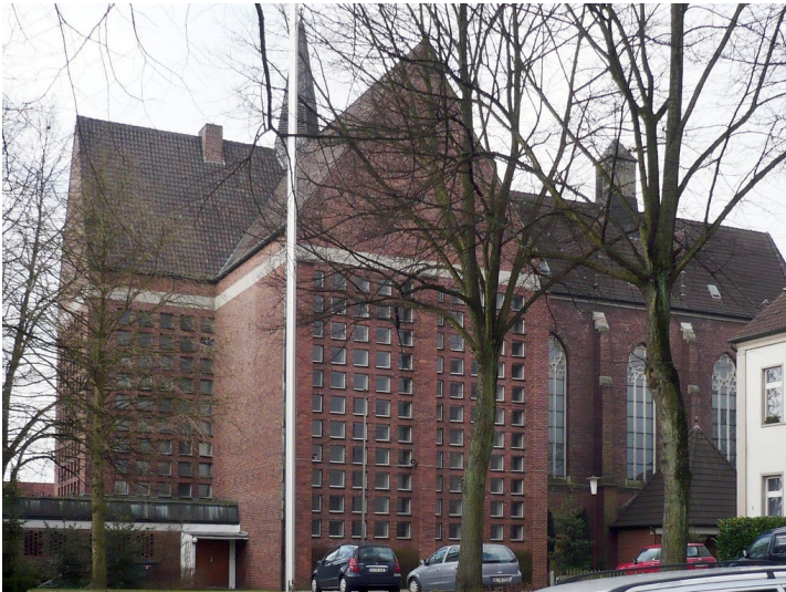
St. Antonius-Kirche in Essen-Freisenbruch (2008)