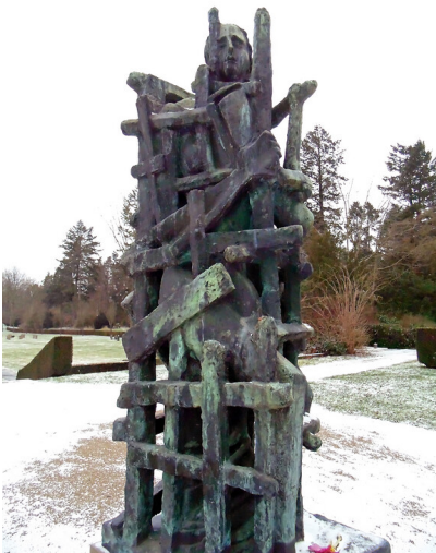
Detailaufnahme der Skulptur "Die Gefangenen" von Ossip Zadkine vor dem Gräberfeld für deutsche Kriegsoffer auf dem Westfriedhof in Köln-Vogelsang (2021).