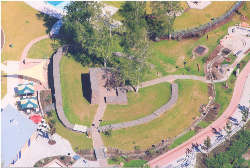
Teilweise restaurierte Burgranlage mit Grundmauern des Wohnturms und der inneren Ringmauer