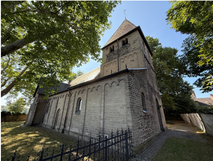
Blick von Norden auf die Kirche Alt Sankt Katharina in Köln-Niehl, auch "Niehler Dömchen" genannt (2025)