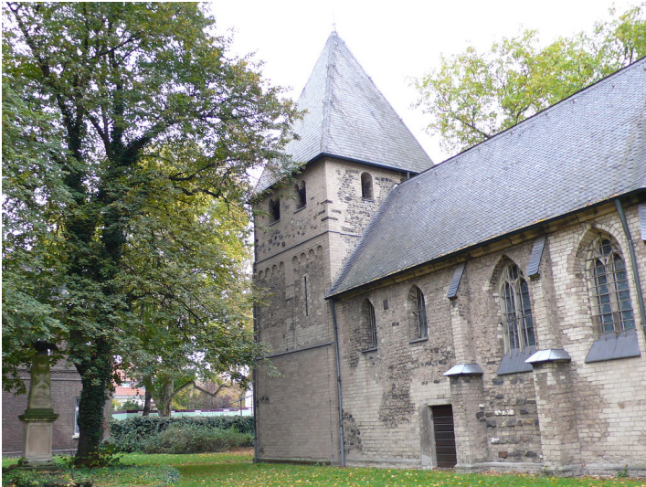
Blick von Süden auf die Kirche Alt Sankt Katharina in Köln-Niehl, auch "Niehler Dömchen" genannt (2007).