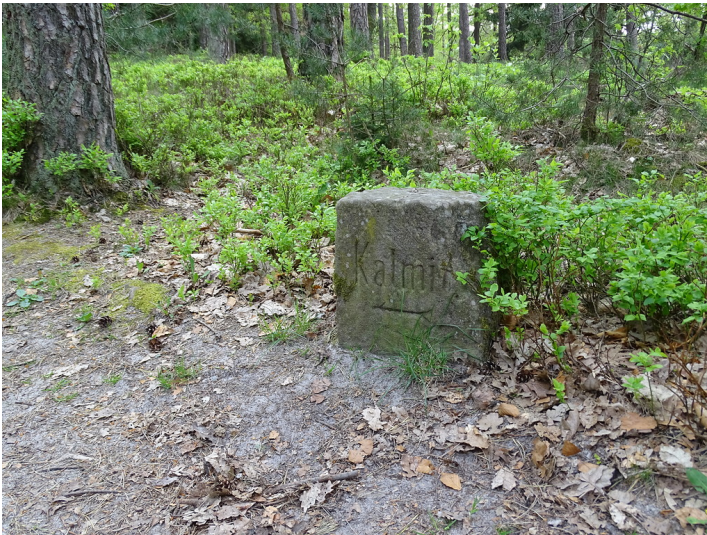
Wegweiserstein mit Richtungsangabe Kalmit (2018)