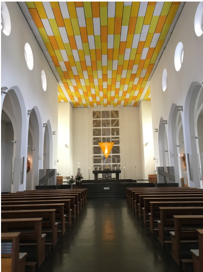
Heilig Kreuz, Klosterkirche (2018)