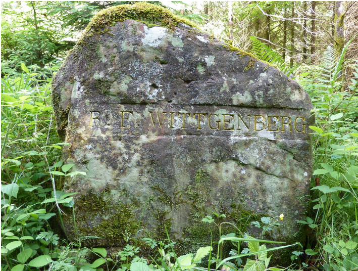
Ritterstein Nr. 116 R.F. Wittgenberg im Hornungstal (2014)