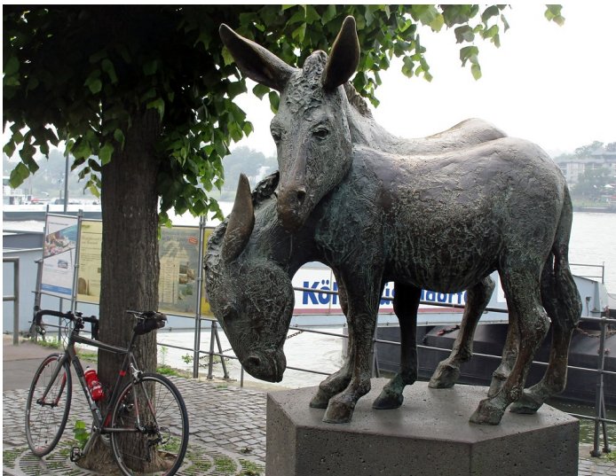
Der 1984 von dem Bildhauer Ernemann Sander geschaffene Eselsbrunnen in der Rheinallee in Königswinter (2018).