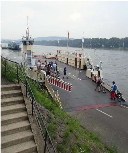
Die zwischen Bonn-Plittersdorf und Niederdollendorf verkehrende Rheinfähre "Konrad Adenauer" beim Anlegen auf der Bonner Rheinseite (2018).