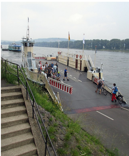
Die zwischen Bonn-Plittersdorf und Niederdollendorf verkehrende Rheinfähre "Konrad Adenauer" beim Anlegen auf der Bonner Rheinseite (2018).