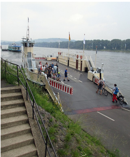
Die zwischen Bonn-Plittersdorf und Niederdollendorf verkehrende Rheinfähre "Konrad Adenauer" beim Anlegen auf der Bonner Rheinseite (2018).