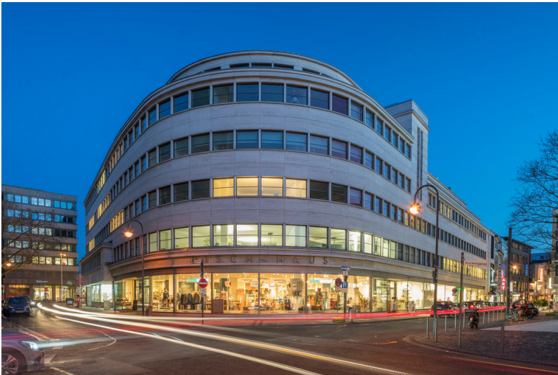
Das Dischhaus in Köln (2018)