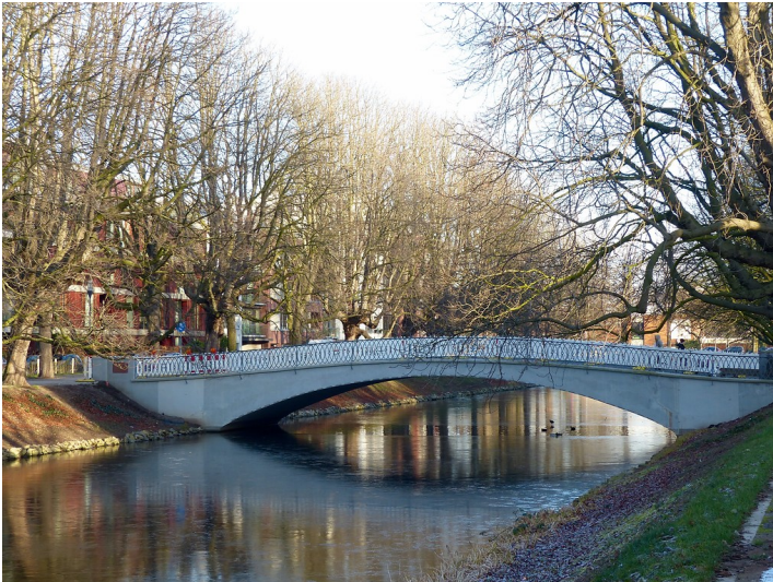
Blick auf eine Brücke über den Clarenbachkanal, auch Lindenthaler Kanal bzw. Kanäle, in Köln-Lindenthal (2016).