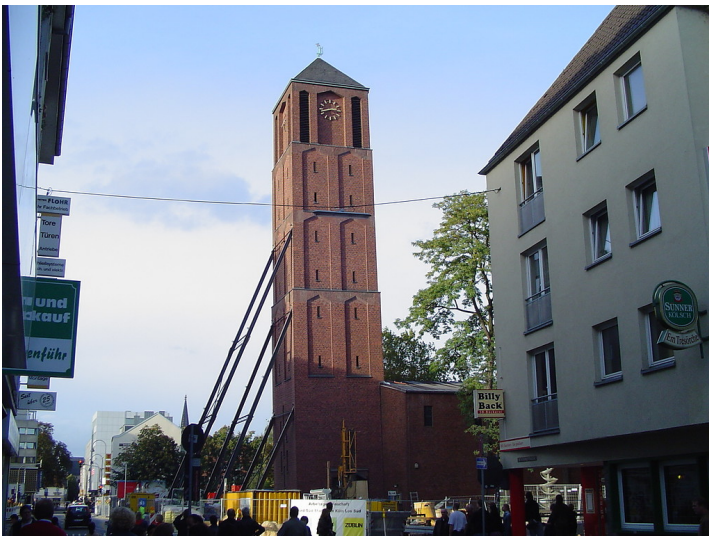
Der abgestützte Kirchturm von Sankt Johann Baptist in Köln-Altstadt-Süd (2004). Im Hintergrund das 2009 eingestürzte Historische Archiv.