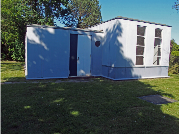
Dessau Siedlung Törten (2018)