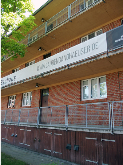
Laubenganghäuser Dessau (2018)