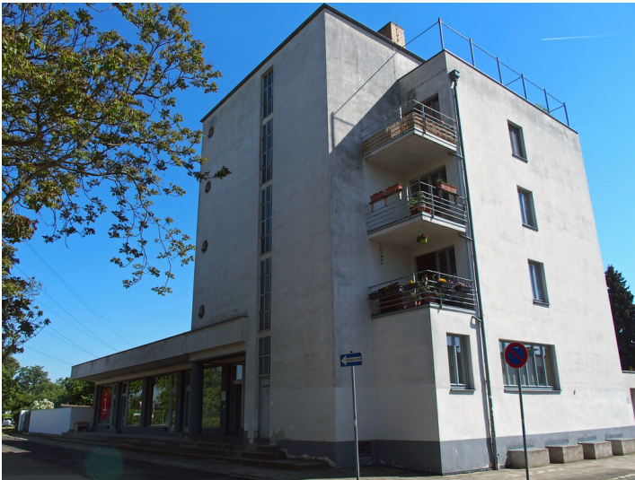
Siedlung Törten in Dessau-Roßlau (2018)