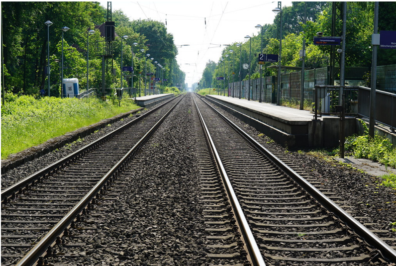
Bahnhof Krefeld-Forstwald. Blick Richtung Mönchengladbach (2018)