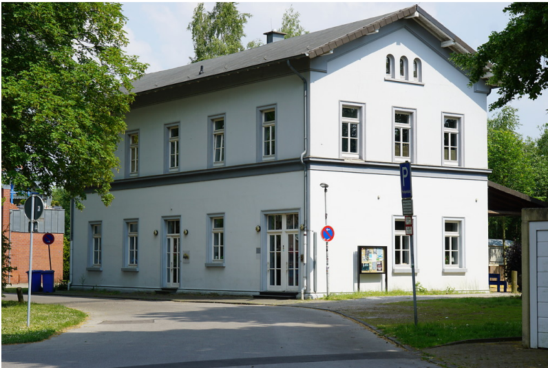
Bahnhof Grefrath, Empfangsgebäude (2018)