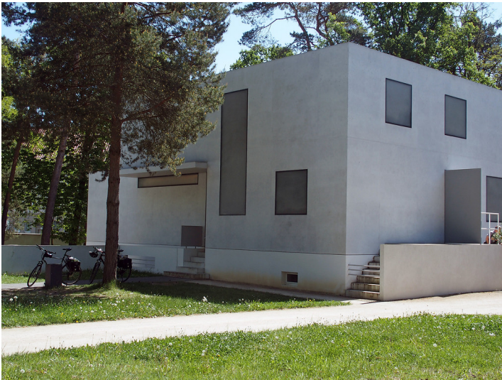
Neue Meisterhäuser in Dessau (2018)