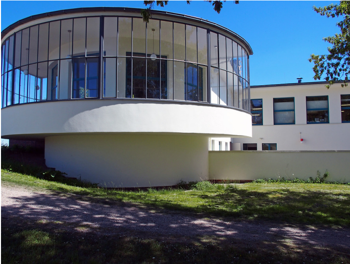
Gaststätte Kornhaus am Dessauer Elbbogen (2018)