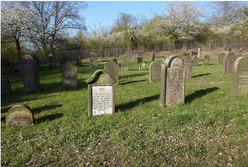
Blick auf das Gräberfeld des jüdischen Friedhofs in Andernach-Miesenheim (2010)