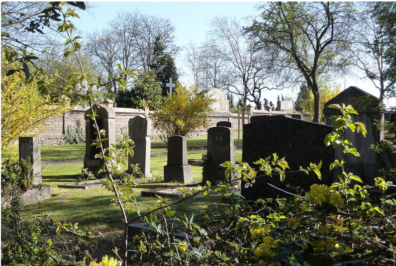
Gräberfeld des jüdischen Friedhofs in der Koblenzer Straße in Andernach (2010)