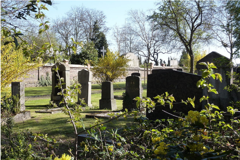
Gräberfeld des jüdischen Friedhofs in der Koblenzer Straße in Andernach (2010)