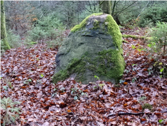
Ritterstein Nr. 115 Glashütte 1767 bei Mölschbach (2018)