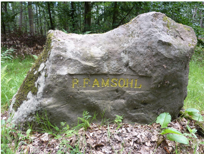
Ritterstein Nr. 114 R. F. Amsohl bei Waldleiningen (2014)