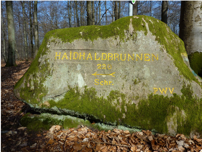
Ritterstein Nr. 108 Haidhaldbrunnen 220 Schr. östlich des Stüterhofs (2014)