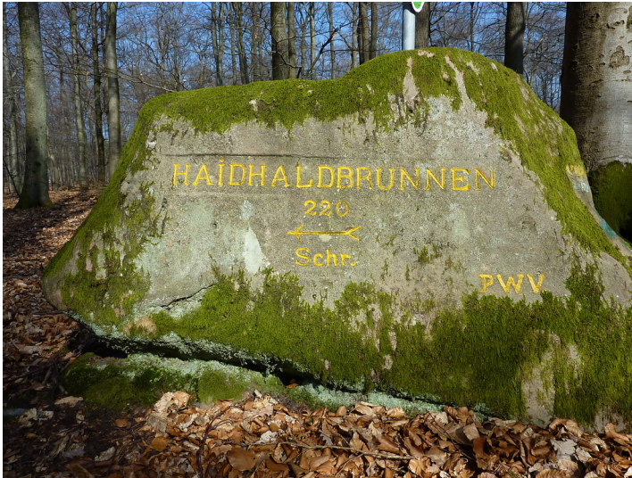
Ritterstein Nr. 108 Haidhaldbrunnen 220 Schr. östlich des Stüterhofs (2014)