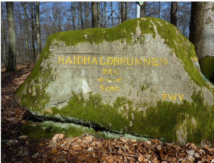
Ritterstein Nr. 108 Haidhaldbrunnen 220 Schr. östlich des Stüterhofs (2014)