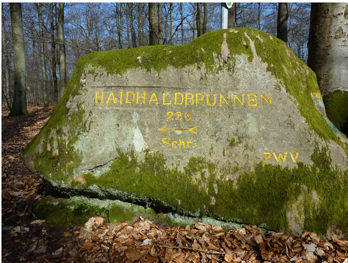
Ritterstein Nr. 108 Haidhaldbrunnen 220 Schr. östlich des Stüterhofs (2014)