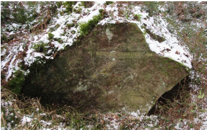
Ritterstein Nr. 102 Moosalbsprung 40 Schr. bei Johanniskreuz (2018)