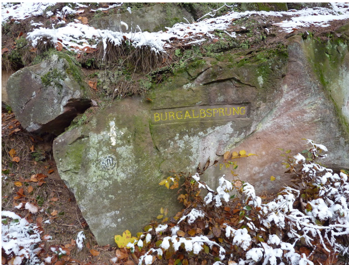
Ritterstein Nr. 101 Burgalbsprung bei Johanniskreuz (2012)