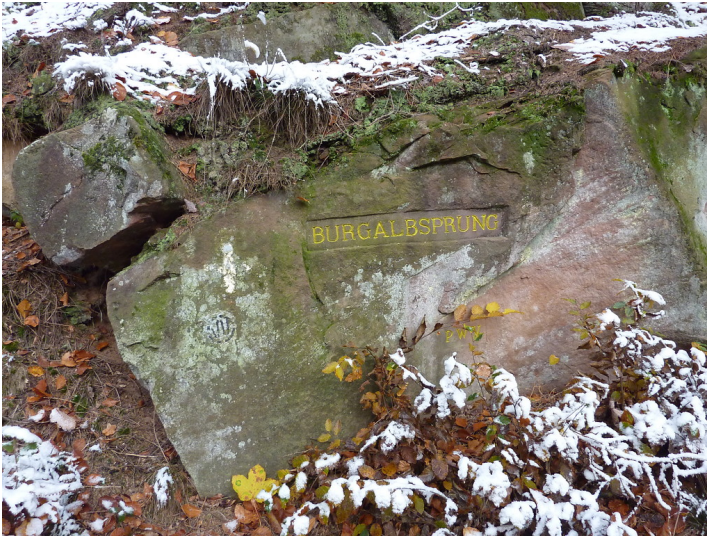
Ritterstein Nr. 101 Burgalbsprung bei Johanniskreuz (2012)