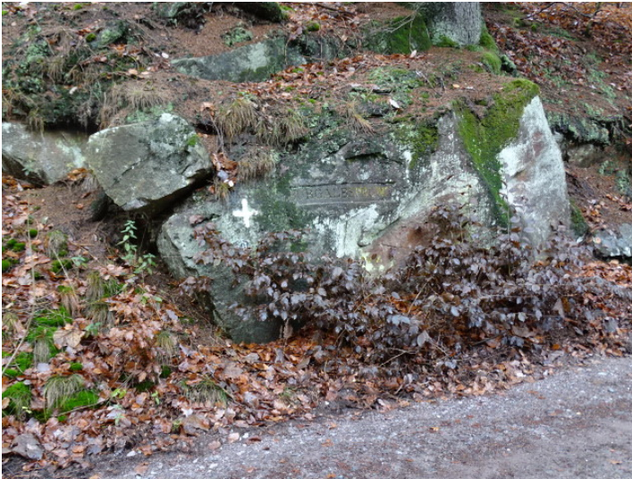
Ritterstein Nr. 101 Burgalbsprung bei Johanniskreuz (2018)