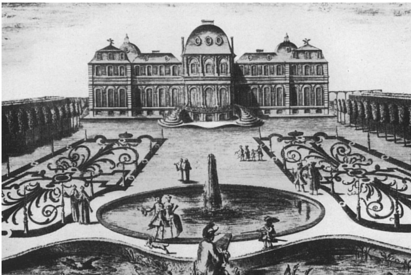
Kupferstich des Poppelsdorfer Schlosses um 1760.