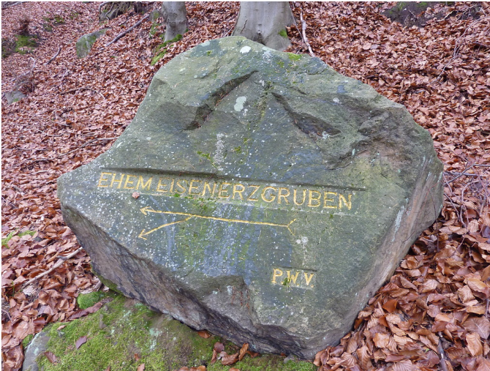
Ritterstein Nr. 30 "Ehem. Eisenerzgruben" bei Bad Bergzabern (2012)