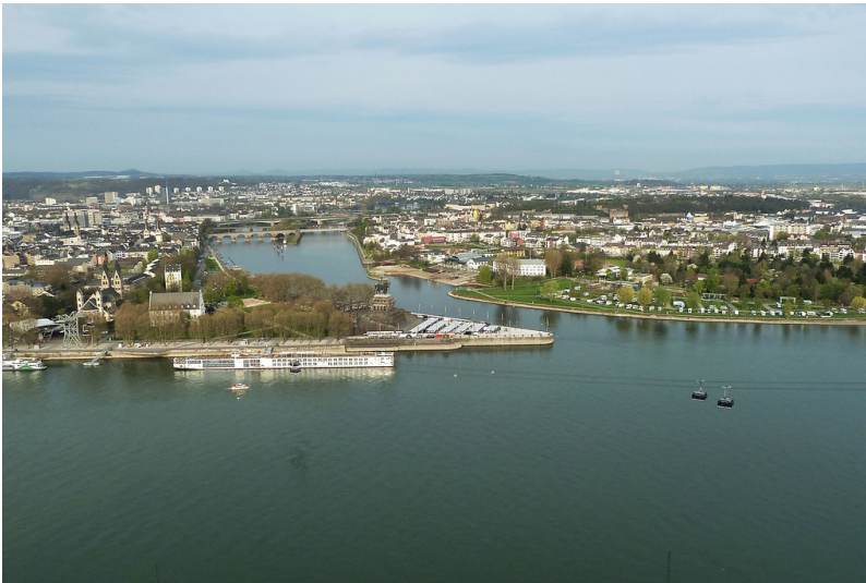
Blick auf Deutsches Eck in Koblenz (2017)