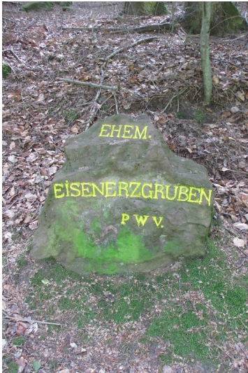
Ritterstein Nr. 28 "Ehem. Eisenerzgruben" bei Böllenborn (2018)