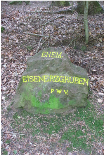
Ritterstein Nr. 28 "Ehem. Eisenerzgruben" bei Böllenborn (2018)