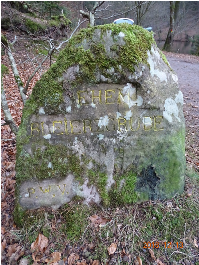
Ritterstein Nr. 29 "Ehem. Bleierzgrube" am Seehofweiher (2018)