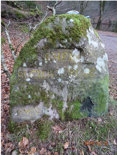
Ritterstein Nr. 29 "Ehem. Bleierzgrube" am Seehofweiher (2018)