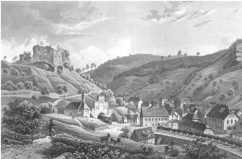
Burgruine Frankenstein am Schloßberg (19. Jahrhundert).