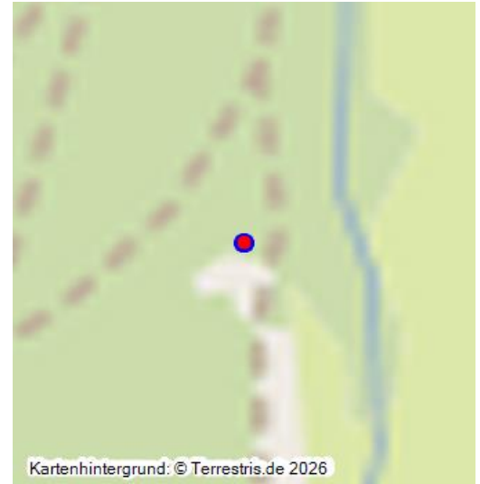
Ritterstein Nr. 191 "Ehem. Silbergrube" bei Bobenthal (2018)

Der Ritterstein „Ehem. Silbergrube“ (Ritterstein Nr. 191) befindet sich nördlich von Bobenthal am Waldrand, auf dem Weg vom Mattental zur Wieslauter. Nordöstlich des Rittersteins steht ein hohes Flurkreuz aus dem Jahr 1804.