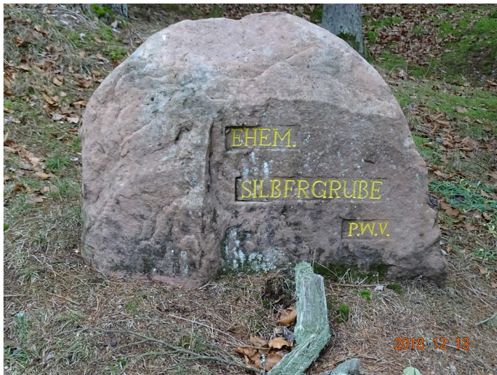
Ritterstein Nr. 191 "Ehem. Silbergrube" bei Bobenthal (2018)