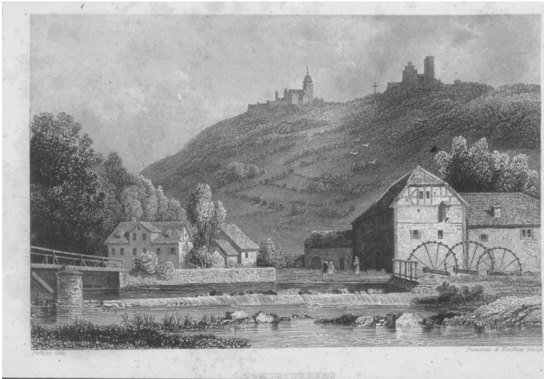
Ansicht der Burgruine Michelsburg und der Benediktinerpropstei Remigiusberg von Südosten (um 1835).