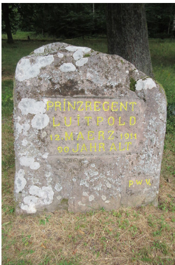
Ritterstein Nr. 70 "Prinzregent Luitpold 12. März 1911 90 Jahre alt" bei Hermersbergerhof (2018)