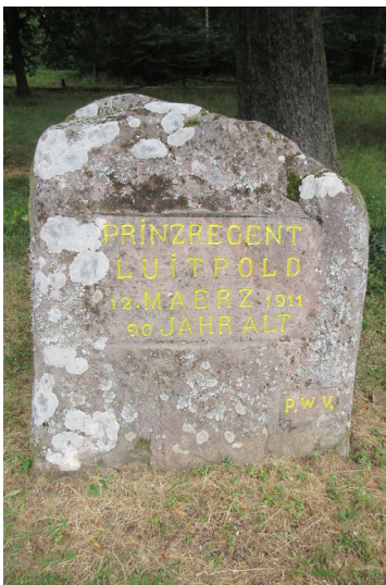
Ritterstein Nr. 70 "Prinzregent Luitpold 12. März 1911 90 Jahre alt" bei Hermersbergerhof (2018)