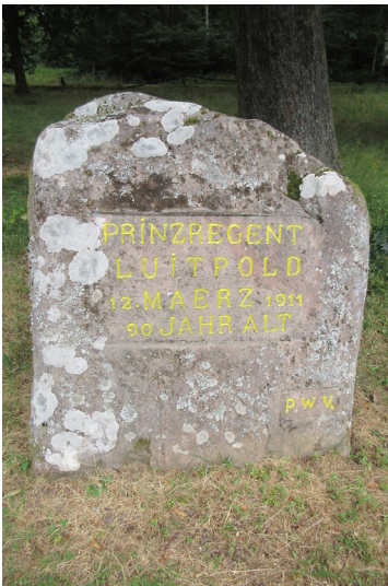
Ritterstein Nr. 70 "Prinzregent Luitpold 12. März 1911 90 Jahre alt" bei Hermersbergerhof (2018)