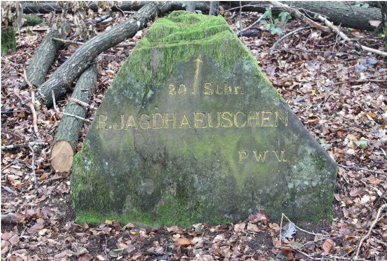
Ritterstein Nr.60 "R. Jagdhäuschen 20 Schr." am Weißenberg nördlich von Hermersbergerhof (2021)