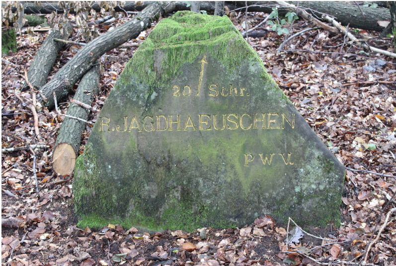
Ritterstein Nr.60 "R. Jagdhäuschen 20 Schr." am Weißenberg nördlich von Hermersbergerhof (2021)