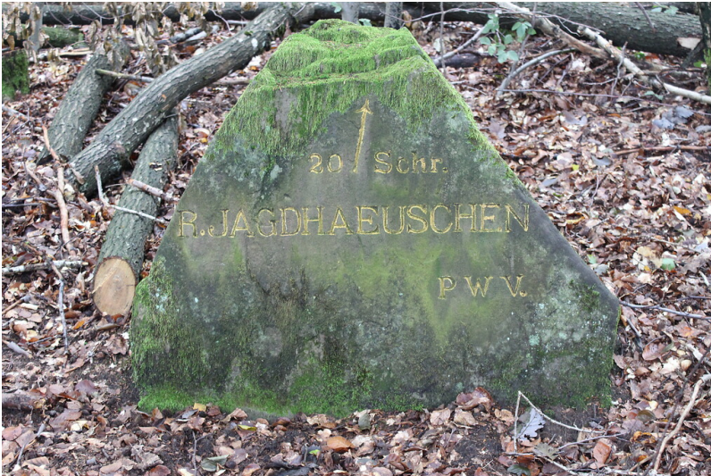
Ritterstein Nr.60 "R. Jagdhaeuschen 20 Schr." am Weißenberg nördlich von Hermersbergerhof (2021)