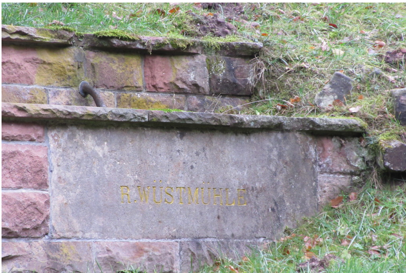
Ritterstein R. Wüstmühle