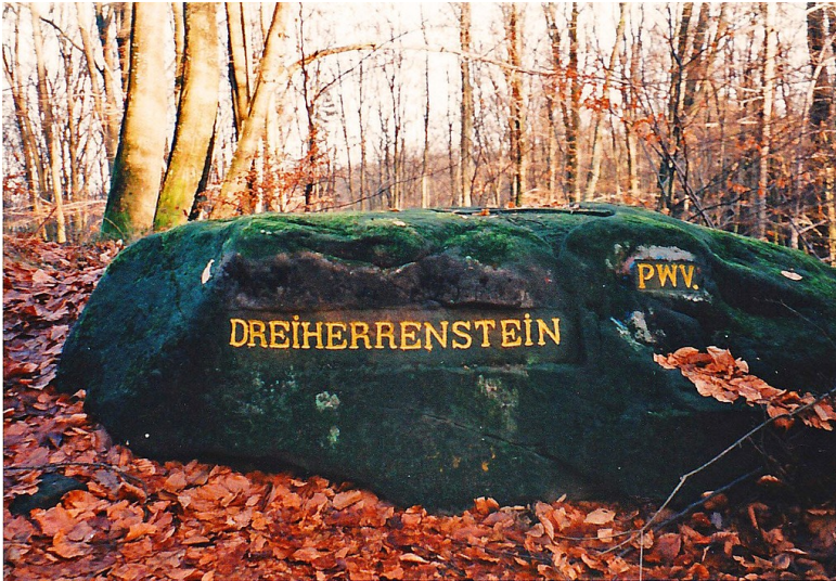
Ritterstein Nr. 57 Dreiherrenstein bei Hermersbergerhof (1998)